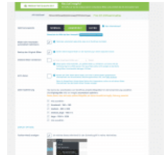
Table of Contents+

Link zum Plugin: imagify bei WordPress.org